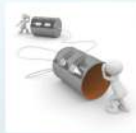
เวลาสองทุ่ม Telefonkonferenz THARA Teamwork