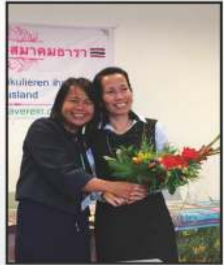
งานประชุมสามัญประจำปี 2017 และการเลือกตั้งคณะกรรมการชุดใหม่ ที่เมือง Berlin