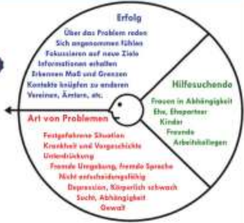
2. ผู้ขอความช่วยเหลือ